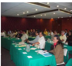
Diplomado en el CF

Unidad de Manejo Forestal Autlán, clave UMAFOR 1406 Autlán, ubicada en el SW del estado de Jalisco, comprendiendo los municipios de Autlán, Ayutla, Cuautla, Ejutla, El Grullo, El Limón, Juchitlán, Tonaya, Tuxcacuesco y Unión de Tula, con una extensión aproximada de 403,484.78-30 ha.